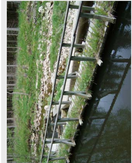
Zwickauer Mulde

Sächsische Landesstiftung Natur und Umwelt - Akademie Wilsdruffer Str. 18 01737 Tharandt