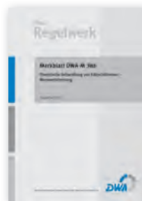
Merkblatt DWA-M 386

Juni 2014 58 Seiten, A4 ISBN 978-3-944328-60-7 78,00 €*