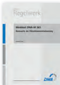
Merkblatt DWA-M 383

Oktober 2007 39 Seiten, A4 ISBN 978-3-939057-86-4 39,00 €*