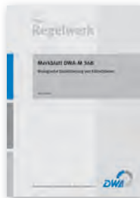
Merkblatt DWA-M 368

Februar 2013 49 Seiten, A4 ISBN 978-3-942964-80-7 62,00 €*