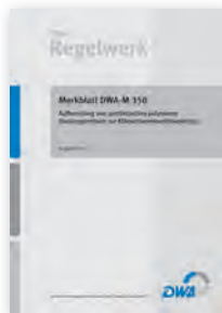
Merkblatt DWA-M 350

Dezember 2016 99 Seiten, A4 ISBN Print: 978-3-88721-422-7 ISBN E-Book: 978-3-88721-423-4 99,50 €*