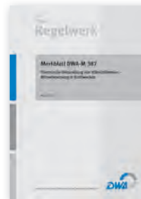
Merkblatt DWA-M 387

Dezember 2011 57 Seiten, A4 ISBN 978-3-942964-03-6 63,00 €*