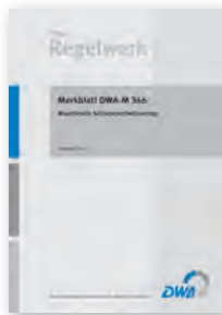
Merkblatt DWA-M 366

August 2014 35 Seiten, A4 ISBN 978-3-944328-59-1 49,00 €*