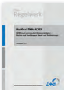
Merkblatt DWA-M 369

Mai 2012 48 Seiten, A4 ISBN 978-3-942964-29-6 52,00 €*