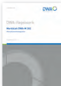
Merkblatt DWA-M 302