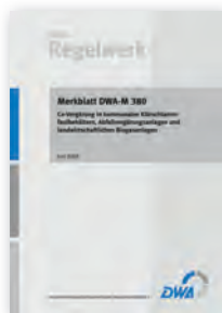
Merkblatt DWA-M 380

September 2015 33 Seiten, A4 ISBN 978-3-88721-256-8 44,50 €*