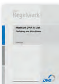
Merkblatt DWA-M 381

Juni 2009 58 Seiten, A4 ISBN 978-3-941089-63-1 52,00 €*